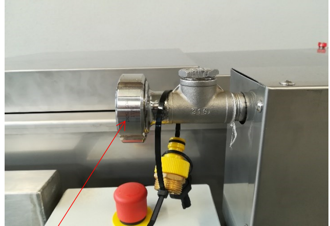
Wziernik poziomu cieczy w topiarce

Urządzenie to przeznaczone jest do odzyskiwania wosku i miodu z odsklepow. Składa się ze zbiornika zewnętrznego oraz z rusztu które są wypełnione mieszanką glikolu z wodą .